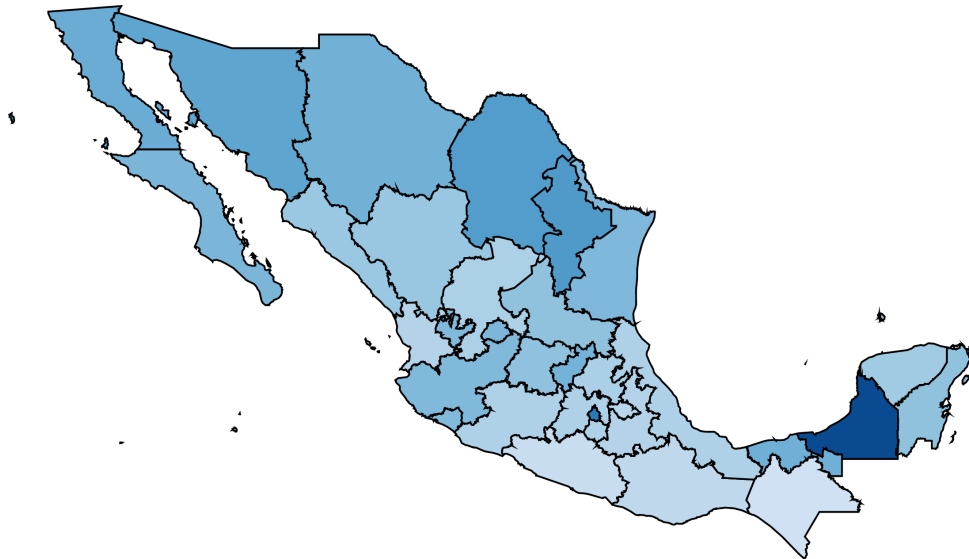
Coeficiente de GINI ajustado por el PIB por entidad federativa - Total - 2024

Miles de pesos ajustados por la desigualdad